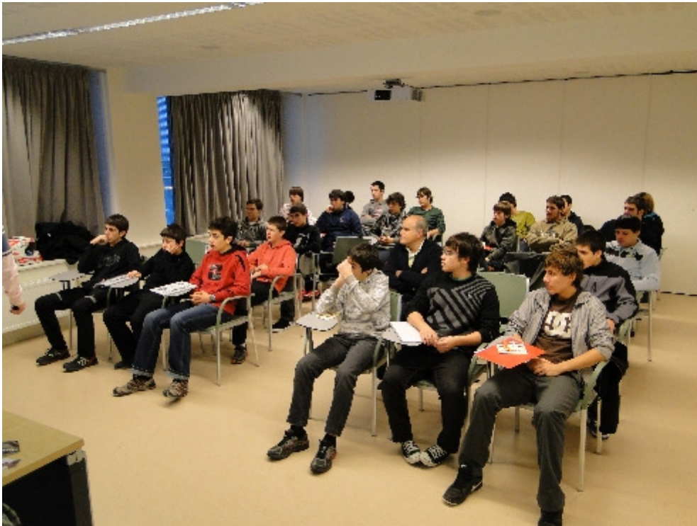
Asistentes al curso de árbitros.