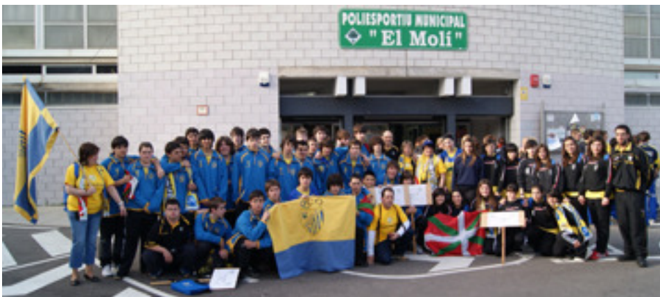
Los integrantes de la expedición ante el pabellón deportivo.