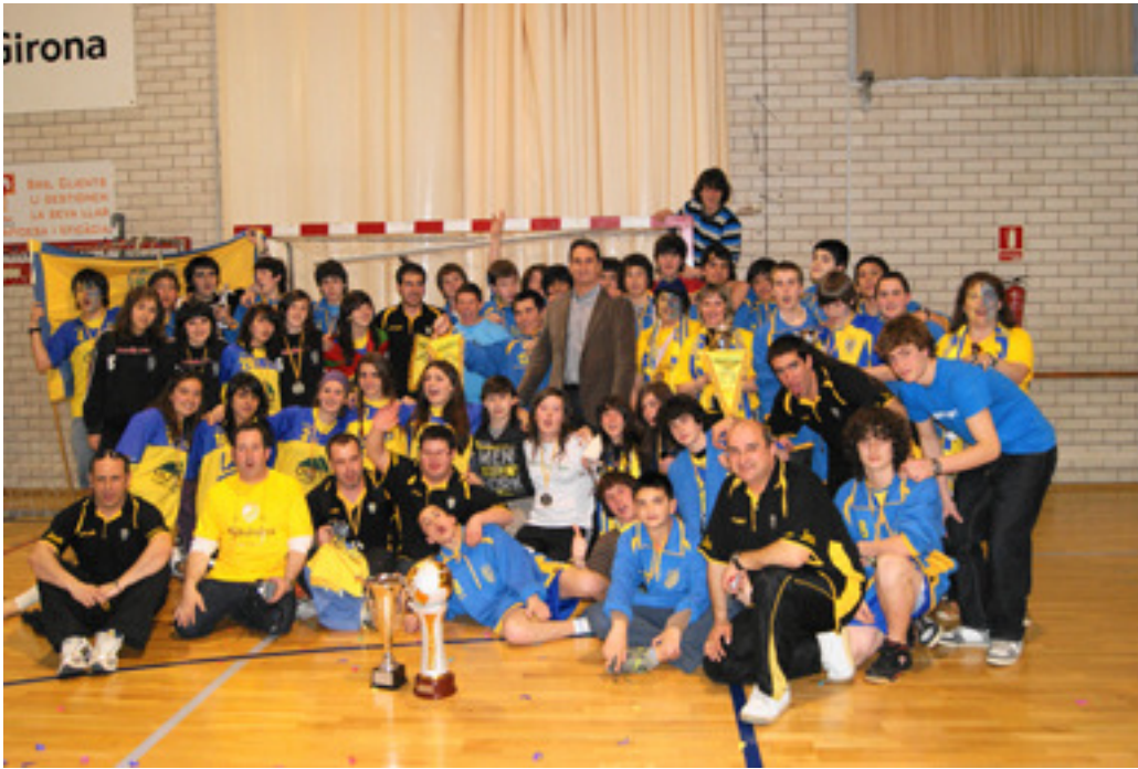
Los equipos con el seleccionador de la selección Española, Valerio Rivera.